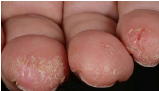
Fig. 1. Allergi over for akrylat med eksem på finger-spidser.

Fig. 1. Allergy to methacrylate showing as eczema on finger tips.