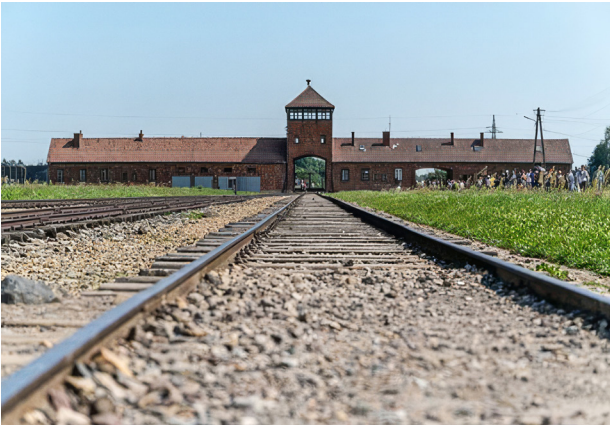
Fig. 7. Auschwitz-Birkenau, som husede nogle af de værste forbrydelser. Fig. 7. Auschwitz-Birkenau, which housed some of the worst crimes.