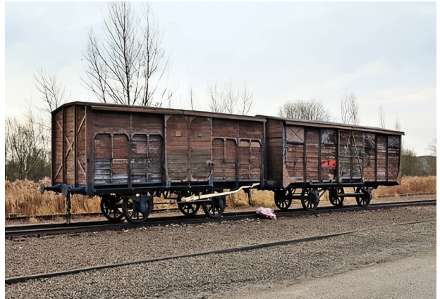
Fig. 8. En af de bevarede vogne fra fangetransporterne. Fig. 8. One of the preserved wagons from the prisoner transports.

furt idømt syv års fængsel for sin deltagelse i ”udvælgelsen og gasningen af jøderne samt indsamling af tandguld” (Fig. 8). I mellemtiden havde han været i stand til at genoptage sit arbejde siden 1947 upåagtet indtil 1965. Først som tandlæge i München og fra 1948 i Cannstatt. Han blev løsladt i 1970 for ”god opførsel” og fik ansættelse i et medicinalfirma med tandlægeprodukter. Han døde i 1989 i München.