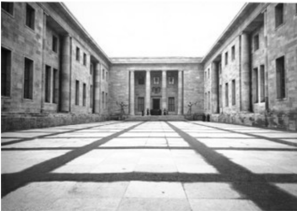
Fig. 1. Æresgården i det nybyggede Rigskancelli. Den underjordiske bunker var bygget i haven.