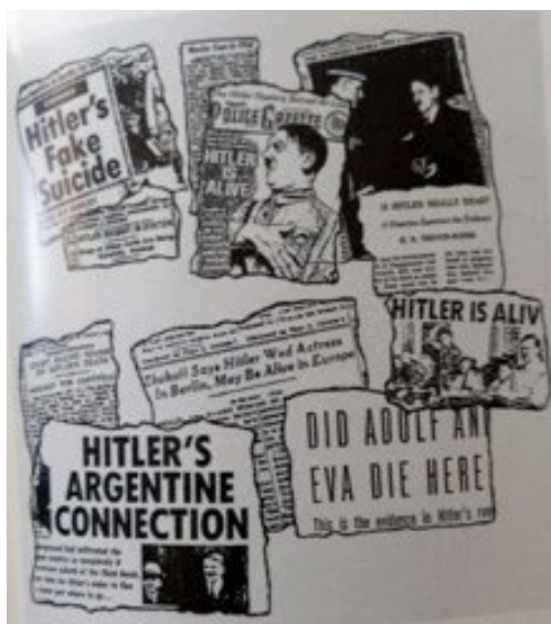
Fig. 8. Konspirationsteoriene florerede og gør det stadig. Fig. 8. Conspiracy theories abounded and still do.