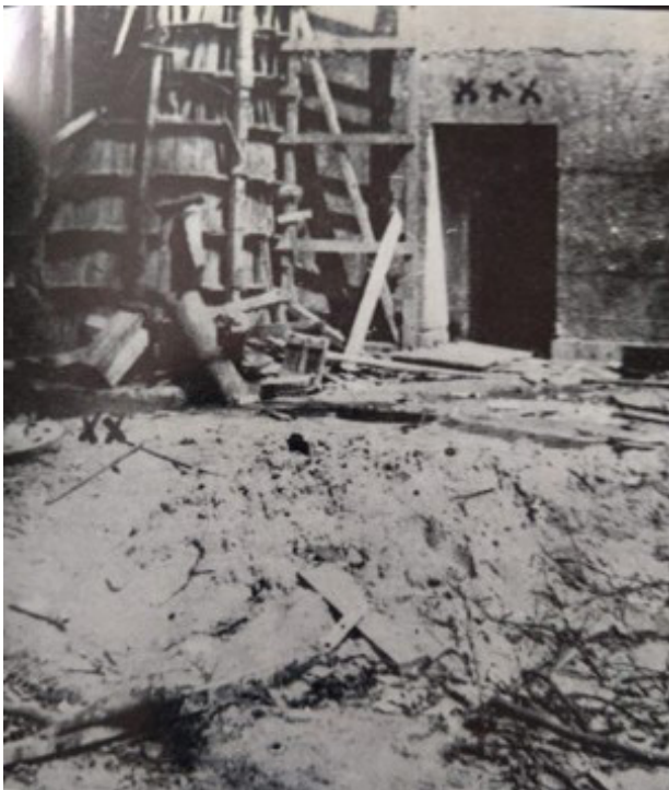
Fig. 4. Udpegning af stedet, hvor Hitlers lig blev brændt sammen med Eva Braun og hundene.