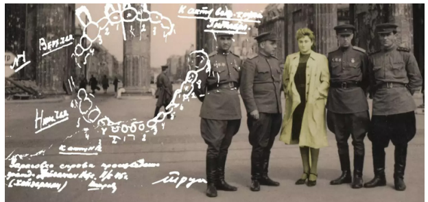
Fig. 3. SMERSH-gruppen ved ankomsten til Berlin. Tandsættet er klinikassistentens erindring.