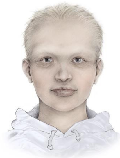
Fig. 1. Illustration af en ung mand med HED. Illustration: Malin Bernas Theisen, TAKO-senteret.