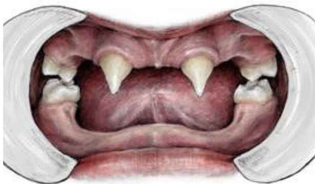
Fig. 2. Drengene med HED udvikler oftest få tænder, og tænderne har atypisk form. Illustration: Malin Bernas-Theisen, TAKO-senteret.