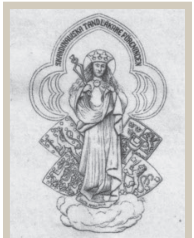
Fig. 11. Logo for Skandinaviska Tandläkareföreningens Tidskrift 1892. Gengivelsen af Skt. Apollonia er en aftegning af predellaen fra Nordlunde Kirke (se Fig. 4). Motivet anvendtes senere på forsiden af Dansk Tandlægeblad i 1900-1901.

Ved indvielsen af Århus Tandlægehøjskole i 1958 fik skolen en rektorkæde, hvis medaljon prydedes af et minirelief af Skt. Apollonia. Som motiv valgte et klassisk maleri af Carlo Dolci (1616-1681). Skt. Apollonia ses med en – for en gangs skyld ikke overdimensioneret – tang i hånden, og med en tand, der for en gangs skyld »vender rigtigt« i tungen (Fig. 14A).