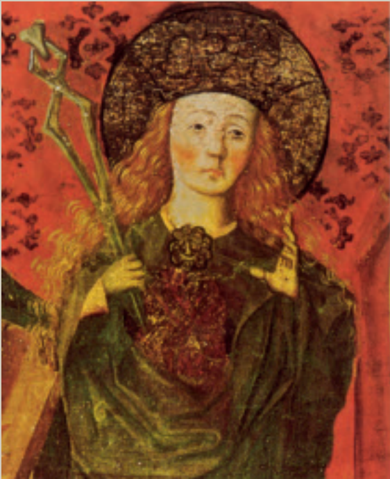
Fig. 4. Velkendt og gentagne gange kopieret billede af Skt. Apollonia (ca. 15 cm højt), som findes på predellaen af en altertavle stammende fra Nordlunde Kirke. Altertavlen opbevares på Nationalmuseet i København.