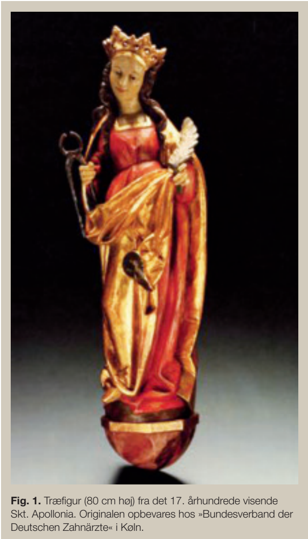
Fig. 1. Træfigur (80 cm høj) fra det 17. århundrede visende Skt. Apollonia. Originalen opbevares hos »Bundesverband der Deutschen Zahnärzte« i Köln.

i den anden. På bagsiden ses en tekst på latin, der i tysk oversættelse lyder (24):