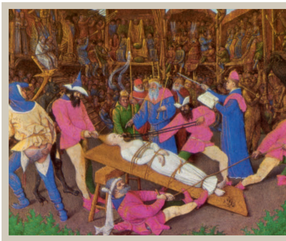
Fig. 2. Kendt miniaturemaleri (12 x 16,5 cm) fra ca. 1450 af Jean Fouquet visende tortureringen af Apollonia. Sceneriet må opfattes som gengivelsen af et af datidens populære kirkespil (»miracle plays«).

klædedragten den i 1400-tallet gældende. Skt. Apollonia er iklædt en hvid klædning, der symboliserer uskylden. Hun ses bundet, og en af hendes tilfangetagere er i færd med at ekstrahere en tand med en ekstremt lang tang. Til venstre ses en biperson, som tilkendegiver sin foragt ved at klø sig i bagen (38).