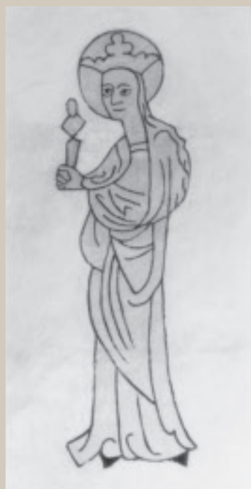
Fig. 3. Det vistnok ældste billede af Skt. Apollonia i Danmark. Det stammer fra ca. 1375 og findes i velbevaret form i Hillerslev Kirke på Midtyn. Højde ca. 1,5 m.

af en ukendt kunstner, der kun kendes fra denne ene kirke. Billederne stammer fra ca. 1510 og er ekstremt fantasifulde. På en pille findes en gengivelse af Skt. Apollonia i en sengotisk, farverig klædedragt (7,17,42).