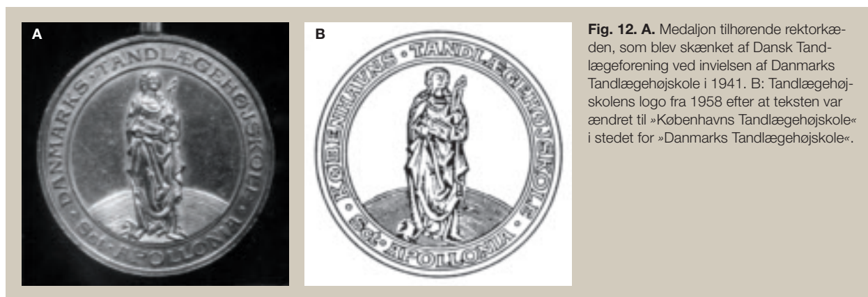
Fig. 12. A. Medaljone tilhørende rektorkæden, som blev skænket af Dansk Tandlægeforening ved invelsen af Danmarks Tandlægehøjskole i 1941. B: Tandlægehøjskolens logo fra 1958 efter at teksten var ændret til »Københavns Tandlægehøjskole« i stedet for »Danmarks Tandlægehøjskole«.