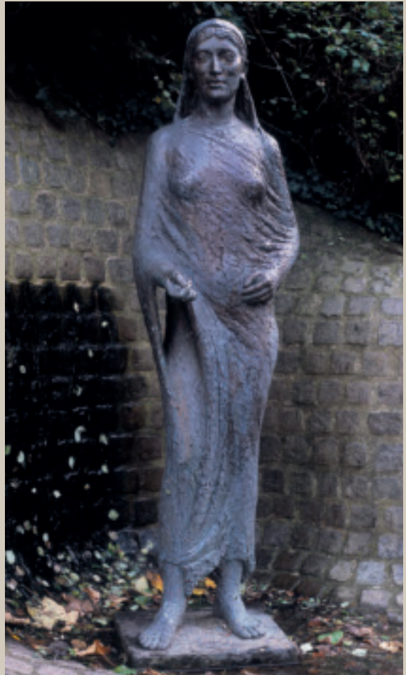
Fig. 8. Statue af billedhuggerinden Hanne Varming opstillet i Viborg i 1994 på stedet, hvor en kilde viet til Skt. Apollonia tidligere havde ligget.