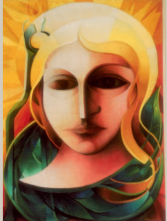
Fig. 6. Maleri (150 x 185 cm) af kunstneren Jørgen Thomsen udført i 1956 i anledning af Københavns Tandlægeforenings 80-års jubilæum. Billedet findes nu i Tryghedsordningernes domicil på Svanemøllevej, København. Bemærk den diskrete gengivelse af en ekstraktionstang øverst til venstre i billedet.

Altertæppe – I Rødning Kirke (nordøst for Viborg) findes et lille antependium (altertæppe) på ca. 60 x 75 cm. Skt. Apollonia