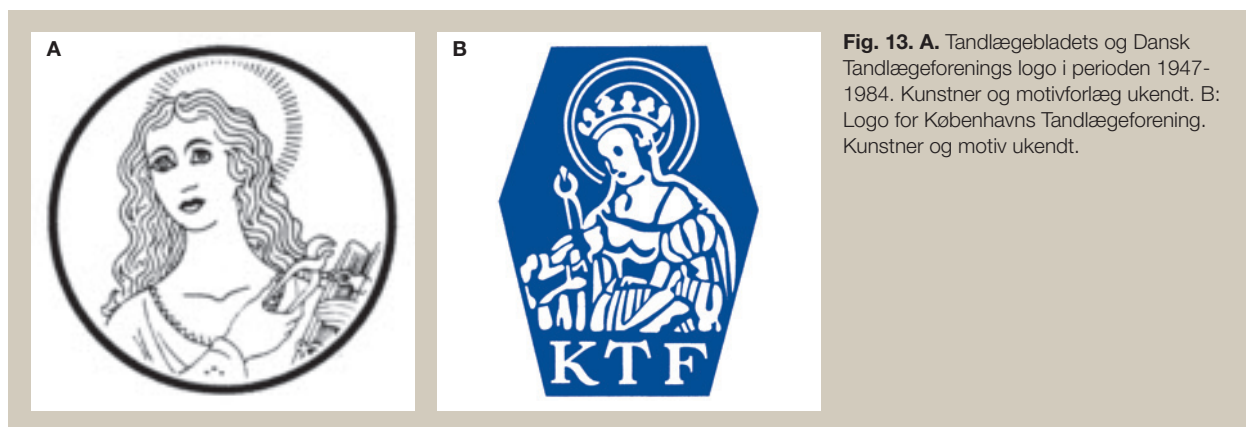
Fig. 13. A. Tandlægebladet og Dansk Tandlægeforenings logo i perioden 1947-1984. Kunstner og motivforlæg ukendt. B: Logo for Københavns Tandlægeforening. Kunstner og motiv ukendt.