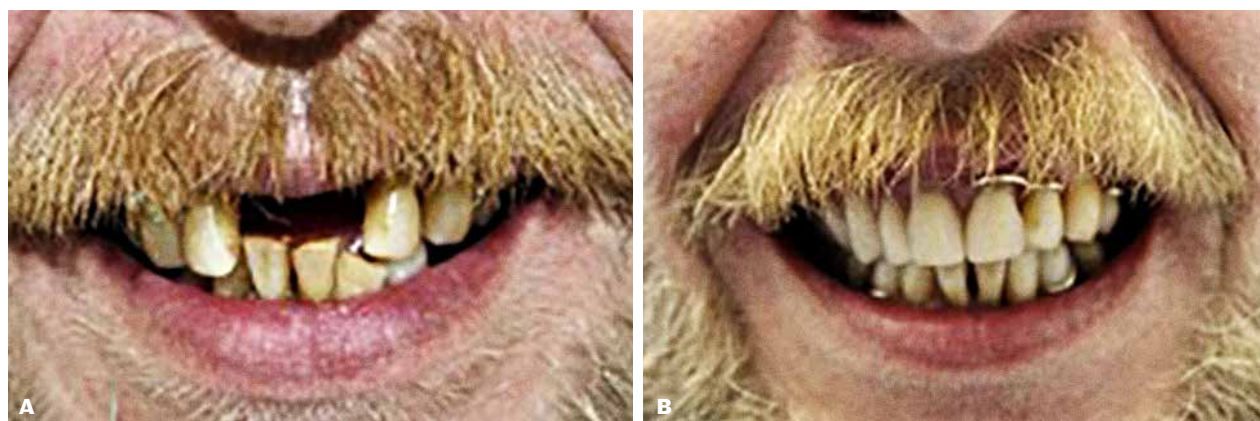
Fig. 3. A. 54-årig hjemløs mand med behov for oral rehabilitering udtaler, at de manglende tænder påvirker hans selvværd og er en barriere for beskæftigelse. B. Efter oral rehabilitering med aftagelige proteser udtaler han, at han ikke længere har nogen æstetiske problemer.

Fig. 3. A. 54-year old homeless man in need of oral rehabilitation stating he feels the lacking teeth affects his self-esteem and is a barrier for employment. B. After oral rehabilitation with removable prosthesis. The man states he no longer have any aesthetic concerns.