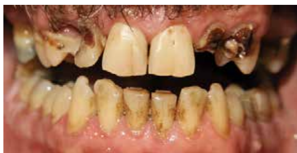
Fig. 2. 49-årig mand med ønske om oral rehabilitering udtaler, at han ikke har nogen æstetiske gener af sit tandsæt, fordi han ”kommer fra arbejderklassen”, og tænderne matcher denne opfattelse.

Fig. 2. 49-year old man with a wish for oral rehabilitation stating that he does not have any aesthetic concerns regarding his teeth because he “comes from the working class” and the teeth matches this notion.