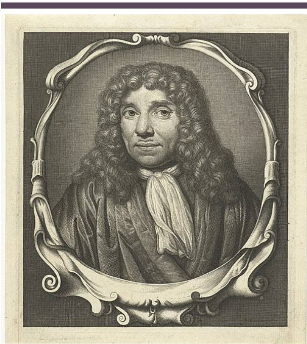
Fig. 1. Anton van Leeuwenhoek (1632-1723).