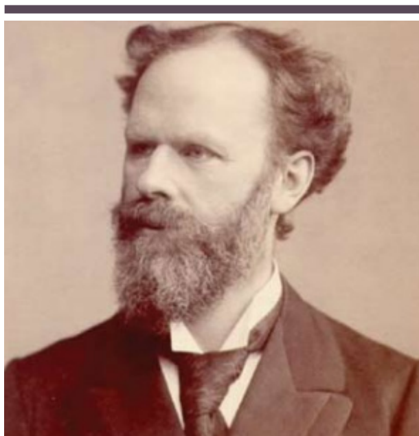
Fig. 11. W.D. Miller (1853-1907).