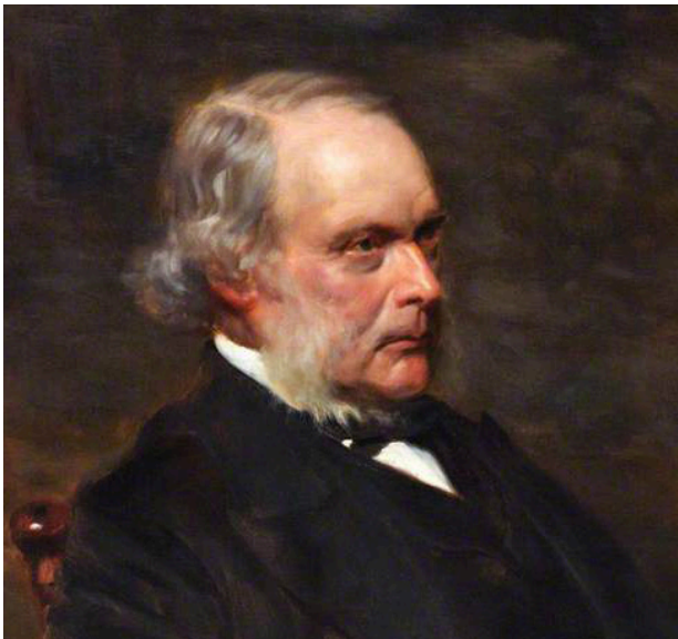
Fig. 8. Joseph Lister (1827-1912). Fig. 8. Joseph Lister (1827-1912).

syv søskende. Han havde nogle fordele fra fødslen, idet hans far var en anerkendt videnskabsmand, som byggede og udviklede linser til mikroskoper. Faderen blev medlem af Royal Society i 1832.