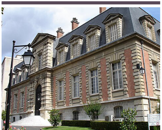
Fig. 5. Pasteurinstituttet i Paris. Fig. 5. Pasteur Institute in Paris.