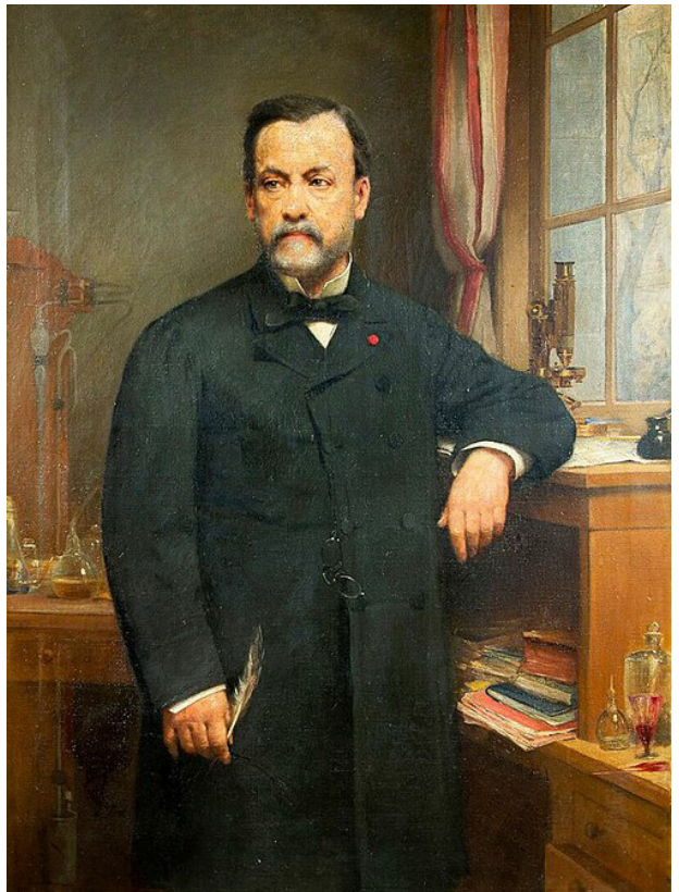
Fig. 4. Louis Pasteur (1822-1895). Fig. 4. Louis Pasteur (1822-1895).

Louis Pasteur (1822-1895) var fransk kemiker og mikrobiolog (Fig. 4). Han studerede fysik og kemi i Paris, og efter endt uddannelse blev han fysiklærer i Dijon. I 1849 blev han professor i kemi i Strasbourg. I 1854 blev han professor i Lille, og i 1857 vendte han tilbage til Paris. I 1888 oprettedes Pasteurinstituttet i Paris (Fig. 5) med det hovedformål at bekæmpe hundegalskab (rabies). Pasteurs styrke var især hans evne til at anvende sin forskning til praktiske formål. Han reddede silkeindustri-