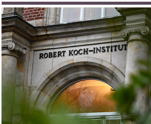
Fig. 7. Robert Koch Instituttet i Berlin.