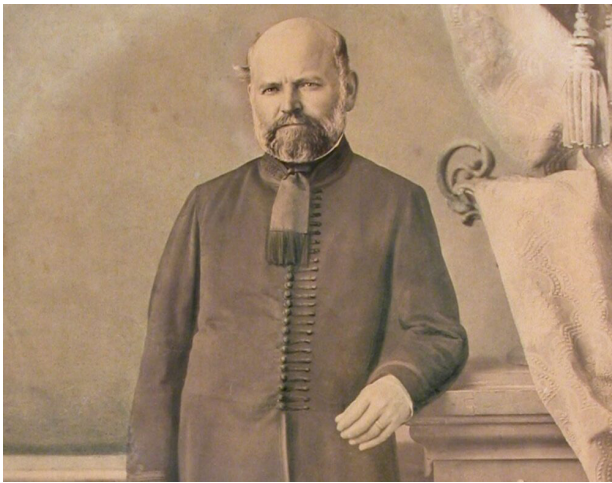
Fig. 3. Ignaz Semmelweis (1818-1865). Fig. 3. Ignaz Semmelweis (1818-1865).

Herefter fulgte en svær tid for ham og familien. Han blev forhånet og fik et nervesammenbrud. Han blev indlagt på et asyl. På asylet blev han slået af vagterne. Han døde 14 dage senere af koldbrand.