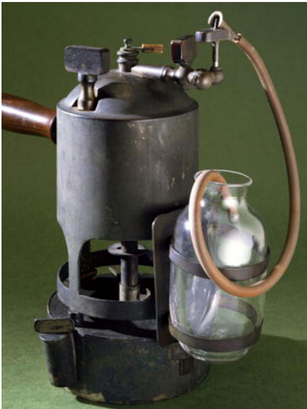
Fig. 9. Karbolspraymaskine. Fig. 9. Carbolspraymachine.

Lister var inspireret af Pasteurs teori om bakterier som årsag til specifikke sygdomme og introducerede antiseptik på operationsstuen ved rensning af hænder og instrumenter med karbolsyre samt afdækning af operationsfeltet. Også Lister blev latterliggjort af kollegaerne, men hans fine resultater gjorde, at flere og flere sluttede sig til de antiseptiske metoder og indså hygiejnens betydning. Han gik så vidt, at han krævede hele operationsstuen sprayet med karbolspray (Fig. 9), hvilket senere har vist sig overflødig. Han rensede også huden og sårene direkte. Kirurgien var ikke anerkendt i starten. Det hele drejede sig om at gøre tingene hurtigt og helst hurtigst. Patienterne blev fastspændt, og kirurgen arbejdede med bare hænder, snavset tøj og instrumenter. Kirurgi var næsten udelukkende overfladeoperationer og amputationer. Operationer i brystkasse og bughule var udelukket, da det i de fleste tilfælde førte til sepsis og død. Englands største kirurg Robert Liston udførte i 1846 den første operation i Europa i æternarkose. Operationen var vellykket, og dermed var vejen banet for store og mere langva-