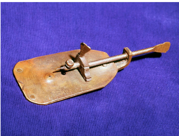
Fig. 2. Leeuwenhoeks selvbyggede mikroskop.