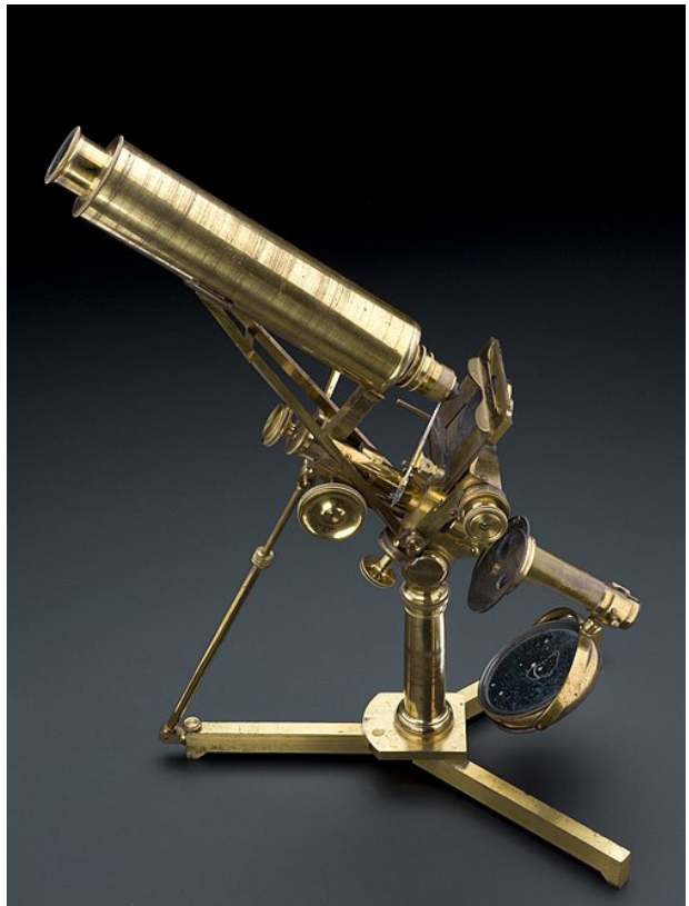
Fig. 10. Mikroskop - en gave fra faderen i 1849 til Lister. Fig. 10. Microscope - a gift from Lister's father in 1849.