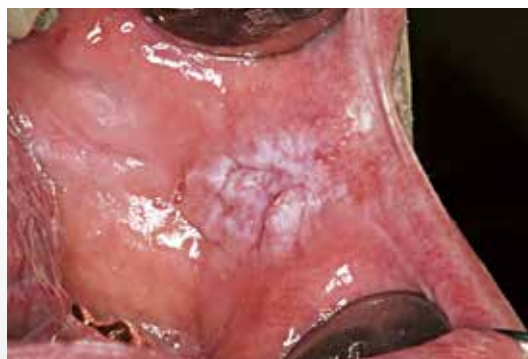
Fig. 3. Non-homogen leukoplaki i kindslimhinden hos 54-årig dansk mand.

Fig. 3. Non-homogenous leukoplakia in 54 years old Danish male.