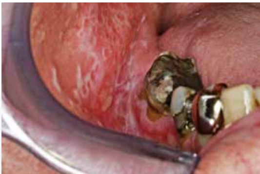
Fig. 4. Oral lichen planus posterior på kindslimhinden hos 76-årig dansk mand.

Fig. 4. Oral lichen planus on the buccal mucosa of a 76 years old Danish male.