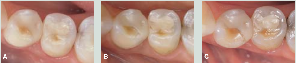
Fig. 1. Restaureringer i plastmaterialet Brilliant Dentin. 4 er behandlet med et indlæg (OD) og 5 med en fyldning (MO) A: Ved baseline. B: Efter fem år. C: Efter 11 år.

Fig. 1. Restorations in the resin material Brilliant Dentin(r). 4 is treated with an inlay (OD) and 5 with a filling (MO). A: At baseline. B: After five years. C: After eleven years.