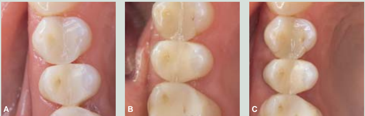
Fig. 2. Restaureringer i plastmaterialet Estilux Posterior. 4+ er behandlet med et indlæg (OD) og 5+ med en fyldning (MOD) A: Ved baseline. B: Efter fem år. C: Efter 11 år.

Fig. 1. Restorations in the resin material Brilliant Dentin(r). 4 is treated with an inlay (OD) and 5 with a filling (MO). A: At baseline. B: After five years. C: After eleven years.