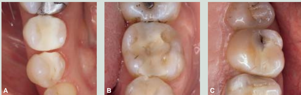
Fig. 4. Eksempler på plastrestaureringer med typiske fejl som førte til omlavning eller reparation. A: Fraktur af distale rand-crista på en to år gammel fyldning i 4 + (OD). B: Okklusal fraktur af fem år gammelt indlæg i 6 - (MOD). C: Sekundær caries okklusalt i relation til to år gammel fyldning i 6 + (OD).