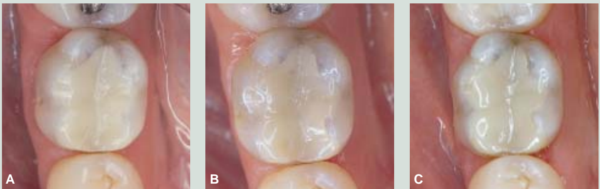
Fig. 3. Restaureringer i plastmaterialet SR-Isocit. 6 er behandlet med et indlæg (MO). A: Ved baseline. B: Efter fem år. C: Efter 11 år.

Fig. 2. Restorations in the resin material Estilux Posterior(r). 4+ is treated with an inlay (OD) and 5+ with a filling (MOD). A: At baseline. B: After five years. C: After eleven years.