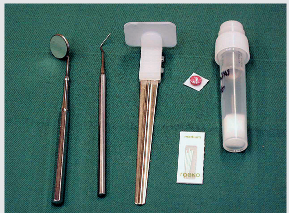
Fig. 2. Hjelpemidler ved etterkontroller.

To funn er av stor interesse ved kontroller etter endt be-