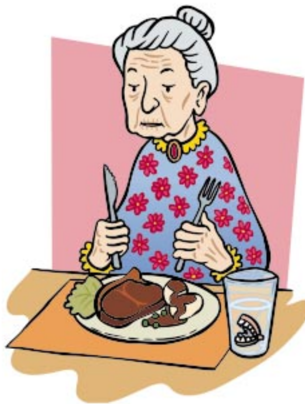
Fig. 2. Mun-, tand- och svalgstatus påverkar äldres förmåga att äta tillräckligt mycket och rätt sorts mat.

Förutom den ökade förskrivningen av läkemedel till äldre bör man beakta att 1) många äldre har svårt att följa ordinatio-