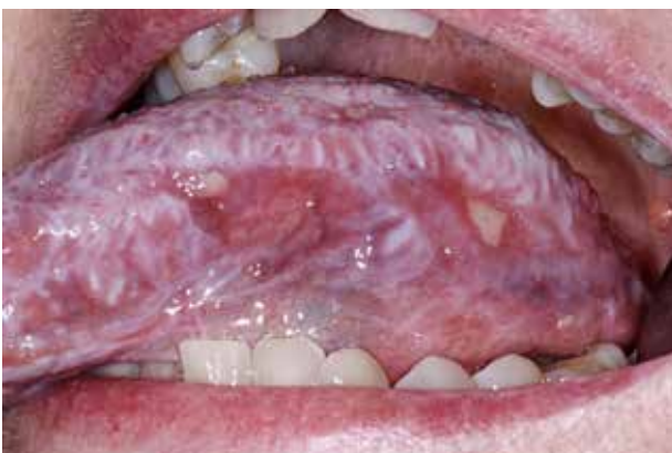
Fig. 5. cGVHD på tungens siderand med likenoide stregtegninger og ulcerationer.

Fig. 5. cGVHD on the tongue with lichenoid striations and ulcerations.