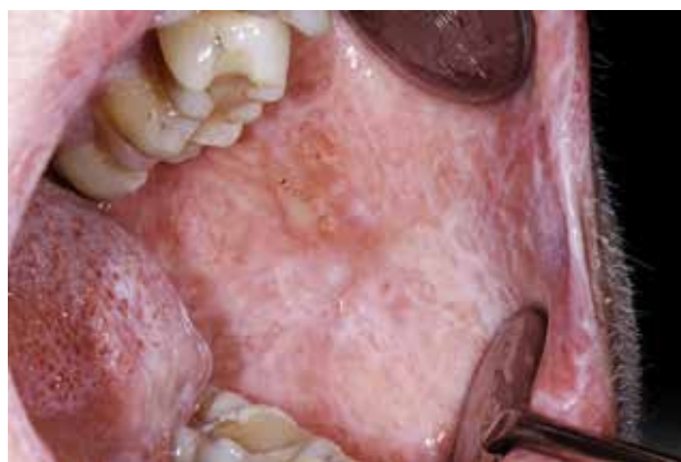
Fig. 3. cGVHD i kindslimhinden. Der ses likenoide stregtegninger og ulcerationer.