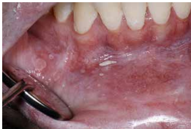
Fig. 7. Mucoceler hos en patient med cGVHD, som desuden lider af mundtørhed. Fig. 7. Mucocelas in a patient with cGVHD who also suffered from dry mouth.

mens orale manifestationer af HIV optræder som følge af immunosuppression.