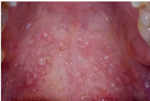
Fig. 6. Mucoceler i den bløde gane hos en patient med cGVHD. Fig. 6. Mucocelas in the soft palate in a patient with cGVHD.