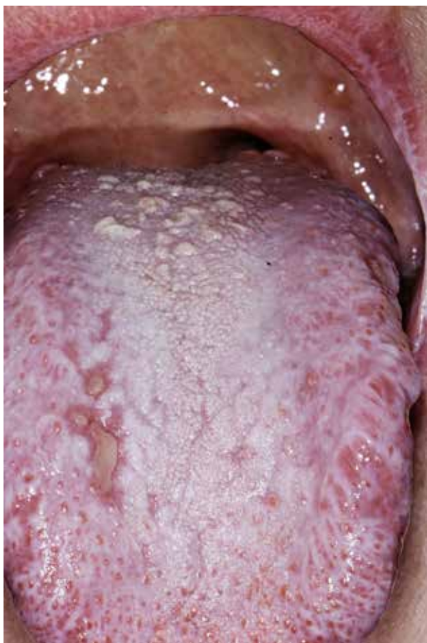
Fig. 4. cGVHD på tungeryggen. Der ses likenoide stregtegninger, plakformationer og ulcerationer.

Fig. 4. cGVHD on the dorsum of the tongue presenting with lichenoid striations, plaques and ulcerations.