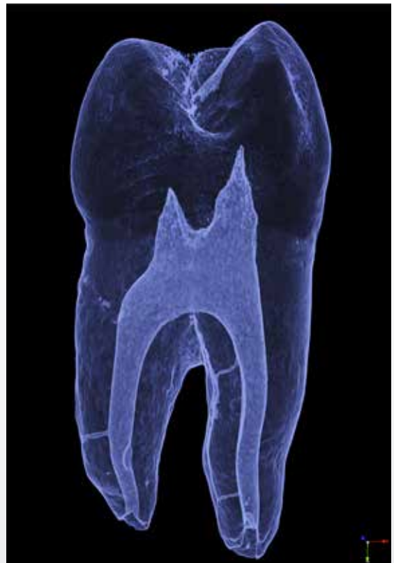
Fig. 2. Tredimensionel afbildning fra mikro-CT scanning af første permanente præmolar med tre synlige lateralkanaler.

Fig. 2. Three dimensional rendering micro-CT scan of a maxillary first premolar showing a total of three lateral canals.