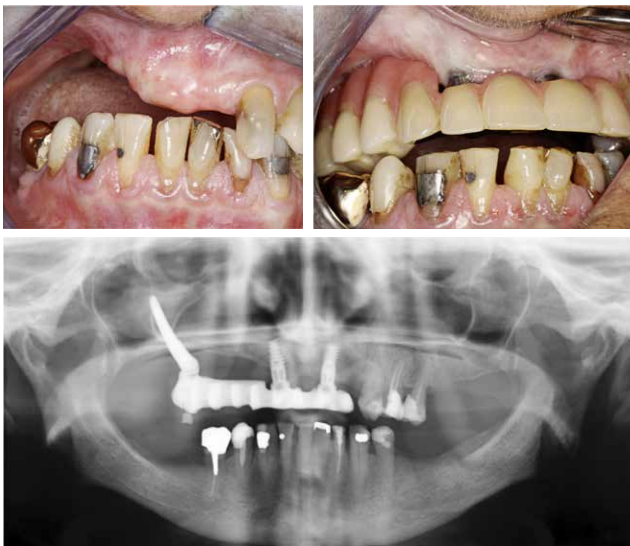
Fig. 2. 80-årig kvinde med resektionsdefekt efter oral cancer. Manglede tænder pga. større resektion af højre processus alveolaris efter planocellulært carcinom, er desuden kendt med diabetes. Der indsættes 1 zygomaimplantat og 2 konventionelle implantater og laves fast bro på disse. Kontrol i 11 år uden komplikationer.