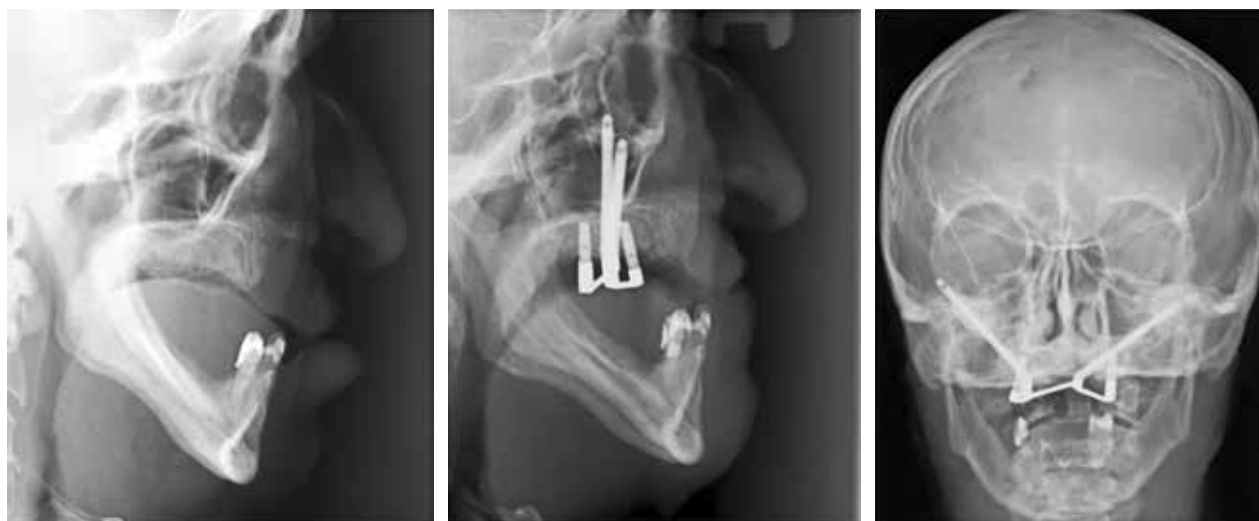
Fig. 1. 64-årig patient med læbe-kæbe-gane-spalte. Havde været tandløs/proteseløs i 15 år. Der indsættes 2 zygomaimplantater og 2 konventionelle implantater med barrekonstruktion. 10-års kontrol uden komplikationer, hvorefter patienten afgår ved døden.