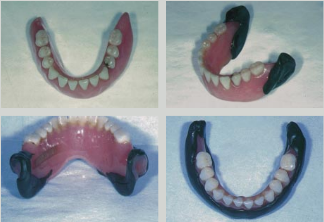
Fig. 4. Adekvat funktionstrimming och rebasering förbättrar ofta situationen i underkäken.