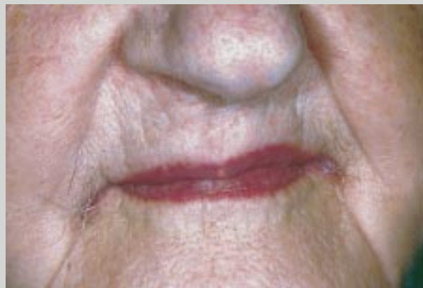
Fig. 3. En 79-årig dam med en frakturerad, 50 år gammal kautschukprotes som lagats med Plastic Padding. Svåra retentionsförhållanden gör att estetiken får komma i andra hand.