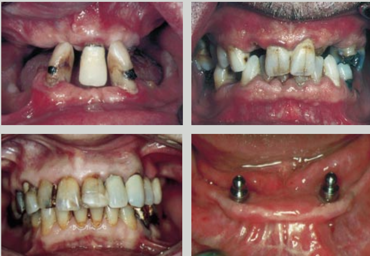
Fig. 1. En tandlös patient och tre patienter som är betandade i båda käkarna. Vem har den sämsta munhälsan och funktionen?

Fig. 1. One edentulous and three patients who are dentated in both jaws. Who has the best and who has the worst oral health and function?