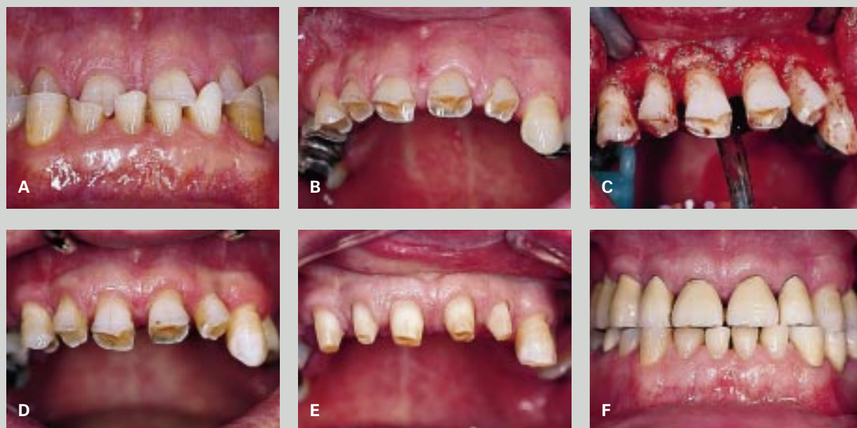
Fig. 2. Et tilfælde af voldsom, generel abrasion (A). B: De korte kliniske kroner viser for ringe retention til en fast protetisk genopbygning af okklusionen. C: Kirurgisk kroneforlængelse er i dette tilfælde indiceret til opnåelse af en generaliseret retentionsgevinst i overkæbefrontregionen. D: Overkæbefrontregionen fire mdr. postoperativt. E: Kroneforlængelsen muliggør udførelse af præparationer med tilstrækkelig retention under samtidig hensyntagen til de biologiske regler for restaureringsrandenes beliggenhed. Bemærk de sunde gingivale forhold. F: Endelig fast protetisk restaurering med genopbyggelse af okklusionen og overholdelse af dimensionerne for den biologiske bredde.