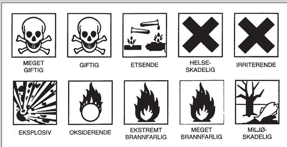
Fig. 3. De forskjellige symboler for advarselsmerking.

ler »lokalirriterende«. Disse lempede regler gjelder for en stor gruppe dentalmaterialer. De informasjonen klinikkene dermed kommer til å mangle, kan imidlertid finnes i de produkt-datablad (»arbejdshygiejniske brugsanvisninger«), som leverandøren alltid skal sende med ved kjøp av merkepliktige materialer.