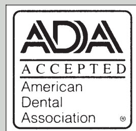
Fig. 7. Den amerikanske tannlegeforenings godkjenningssmerke.