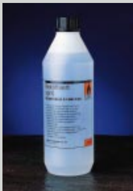
Fig. 4. YL-merking av desinfeksjonssprit i Norge.

Dental products manufactured after June 1998 must have premarketing approval and bear the CE marking in Europe.