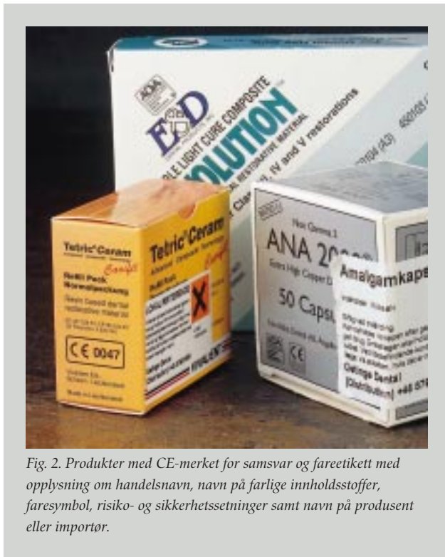
Fig. 2. Produkter med CE-merket for samsvar og fareetikett med opplysning om handelsnavn, navn på farlige innholdsstoffer, faresymbol, risiko- og sikkerhetssetninger samt navn på produsent eller importør.

deres, og hvem som skal utføre denne vurderingen. Produkter med lav risiko for pasient og behandler, for eksempel avtrykksmaterialer, kofferdam og matrisebånd, er plassert i klasse I. For disse produktene kan produsenten selv foreta en vurdering om direktivets krav er oppfylt. Finner produsenten samsvar mellom produktets egenskaper og direktivets krav, kan produsenten CE-merke og markedsføre produktet direkte.