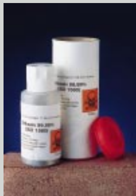
Fig. 5. Helsefaremerking skal som hovedregel finnes både på ytre og indre emballasje.