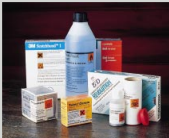
Fig. 1. Produkter merket med CE, helsefaremerking, NIOM certified, ADA Accepted.

Alle dentale produkter som er produsert etter 14. juni 1998, skal være forhåndsgodkjent og påført CE-merket for samsvar (Fig. 2) (2, 3). Dette er et handelsteknisk merke som innebærer at avtalelandene (EØS-landene) ikke kan motsette seg markedsføring av produktet. Direktivet for medisinsk utstyr inneholder de krav som skal stilles til produktet før det kan påføres CE-merket. Kravene er satt i relasjon til den risikoklassifisering som produktet har fått. Denne risikoklassifisering er igjen bygget på produktets indikasjonsoverråde, og har betydning for hvor mye dokumentasjon som skal vur-