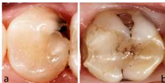
Fig. 2. De to hyppigste årsager til, at kompositfyldninger svigter, er sekundær caries (A) og frakturer (B). Foto: Thomas Jacobsen (A) / Frode Staxrud (B).

Fig. 2. The two most common reasons for failure of resin composite restorations are secondary caries (A) and fractures (B). Photo: Thomas Jacobsen (A) / Frode Staxrud (B).