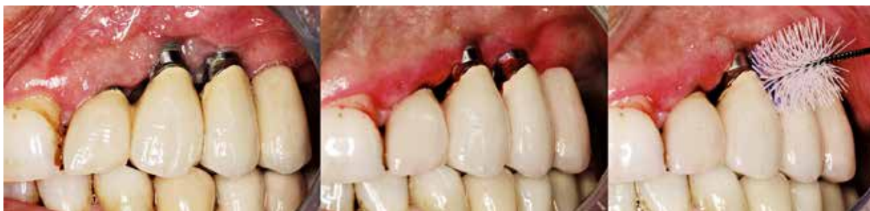
Fig. 6. Vedligeholdelse af implantater efter behandling af periimplantitis. Indfarvning af plak og instruktion i anvendelse af interdentalbørster.