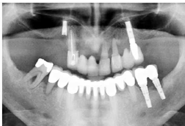
Fig. 7. Undersøgelse af hele tandsættet med henblik på at identificere områder med ubehandlet inflammation er en obligatorisk del af den initiale behandlingsplanlægning.