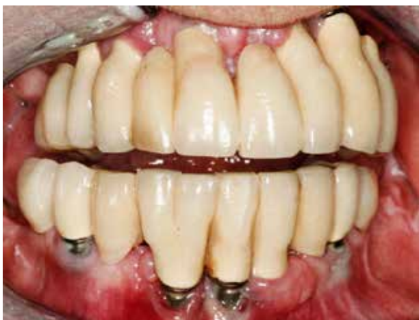
Fig. 2. Implantater med en placering af fikstur og suprastruktur, der vanskeliggør sufficient mundhygiejne, har større risiko for at udvikle periimplantære sygdomme.

Fig. 2. Implants with a positioning and suprastructure that hampers oral hygiene, are more prone to peri-implant diseases.