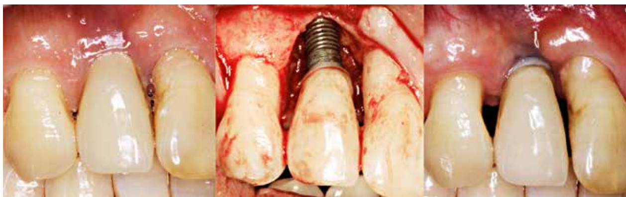
Fig. 3. Resektiv kirurgi bedrer den inflammatoriske tilstand, men kompromitterer det æstetiske resultat. Venstre billede: ubehandlet periimplantitis med dybe periimplantære pocher, blødning ved sondering og periimplantært knogletab. Midterste billede: blottæggelse af knogledefekt, der ikke er velegnet til genopbyggende behandling. Højre billede: efter behandling ses sunde periimplantære forhold med små pochedybder og uden kliniske tegn på inflammation; resultatet er på bekostning af det æstetiske udseende.

Fig. 3. Resective surgery improves the inflammatory conditions, but hampers the aesthetic outcome. Left picture: untreated peri-implantitis identified by deep peri-implant pockets, bleeding on probing and peri-implant bone loss. Middle picture: exposure of bone defect, not suitable for reconstructive therapy. Right picture: following treatment, peri-implant health with shallow pockets and no clinical signs of inflammation at the expense of the aesthetic outcome.