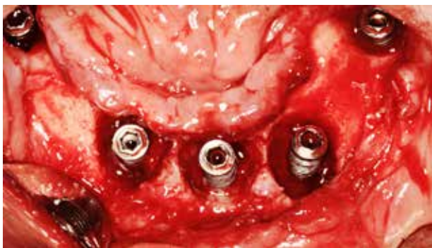
Fig. 1. Defekterne ved periimplantitis er ofte større end defekterne ved parodontitis.

Fig. 1. The size of peri-implantitis defects tend to be larger than those noted at periodontitis sites.