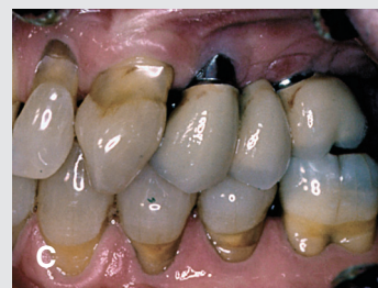
Figur 8-10. Patientfall 3.

Fig. 8. Panoramaxröntgen i anslutning till primärundersökningen 1997.