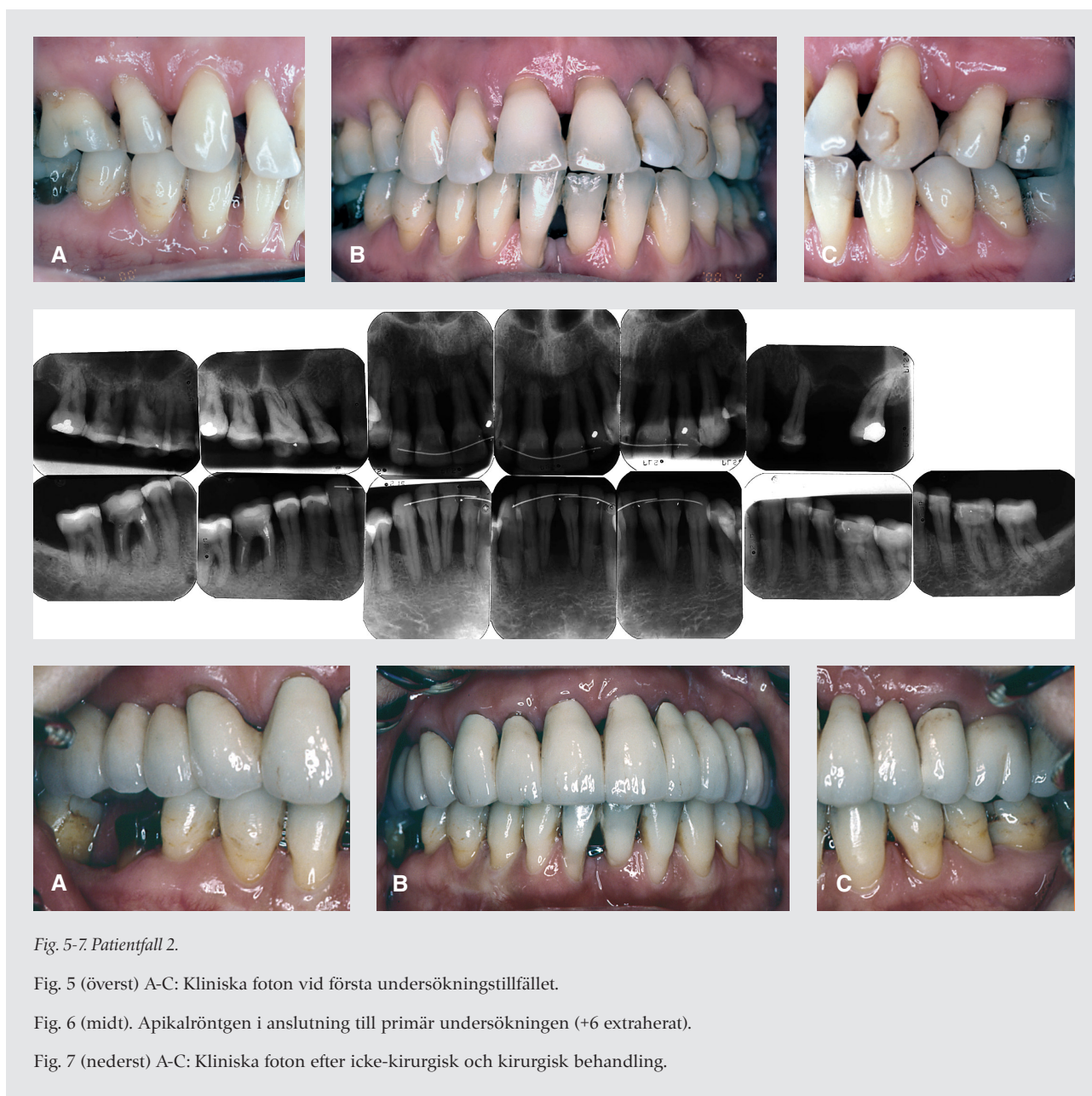
Fig. 5-7. Patientfall 2.

I det här fallet är det viktigt att parodontiten behandlats innan den ortodontiska behandlingen påbörjas. En studie visar att en kombination av inflammation, ortodontiska kraf-