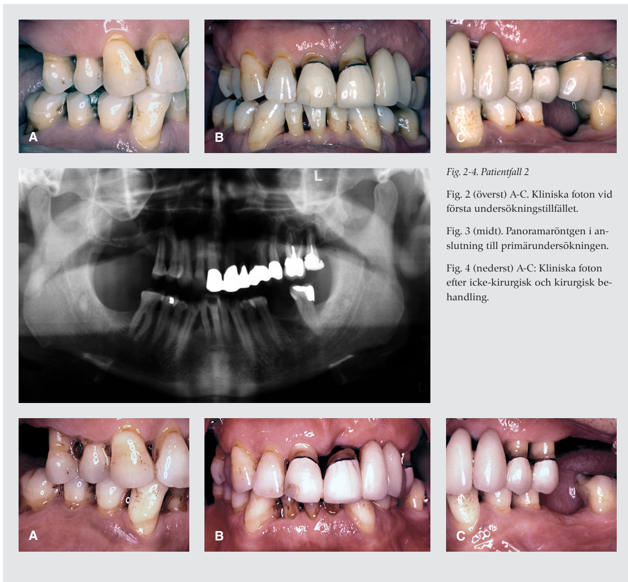
Fig. 2-4. Patientfall 2

Fig. 2 (överst) A-C. Kliniska foton vid första undersökningstillfället.