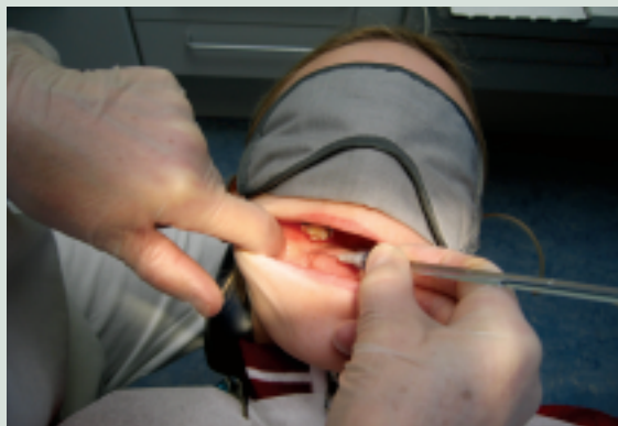
Fig. 1. Patient med »flysovebriller« under injektion.

Forskellen i smerteperceptionen mellem grupperne blev